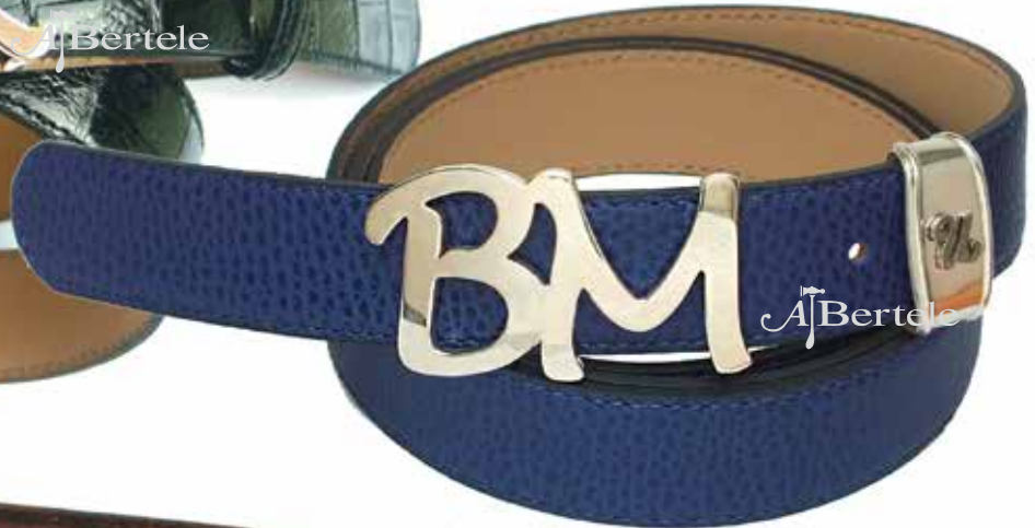
BM Lucida Handwriting